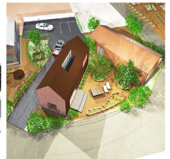
建物2棟446㎡ 外構1180㎡ 168,000円(画像複数アリ)