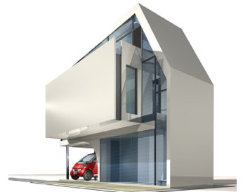
3階建新築 280㎡ 59,000円(画像複数アリ)