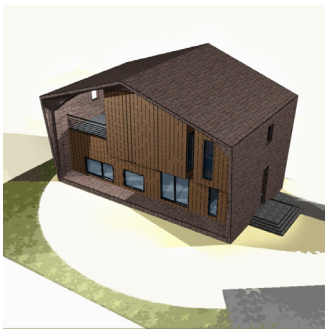
新築住宅 382㎡ 72,000円(画像複数アリ)