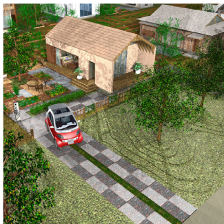
建物4棟966㎡ 外構2200㎡ 296,000円(画像複数アリ)