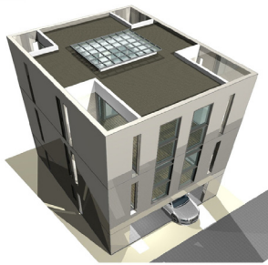
新築マンション 420㎡ 90,000円(画像複数アリ)