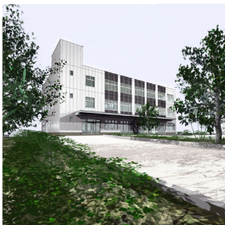
建物1100㎡ 外構170㎡ 184,000円(画像複数アリ)