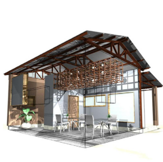
打合せリハ 29.50㎡ 39,000円(画像複数アリ)