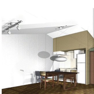
マンションリハ 115㎡ 94,000円(画像複数アリ)