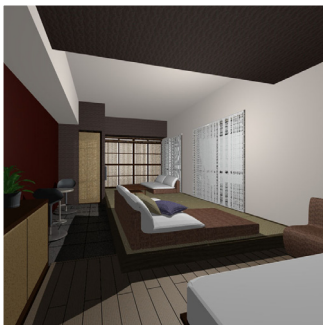
旅館リハ 74㎡ 58,000円(画像複数アリ)